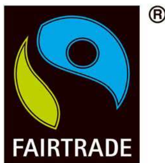
Figure A-1 Symbole du commerce équitable

Une façon pour vous d'agir en citoyen du monde est d'encourager les compagnies qui exercent leurs activités d'une manière responsable dans les pays en développement. Recherchez ce symbole sur les produits dans les magasins près de chez vous.