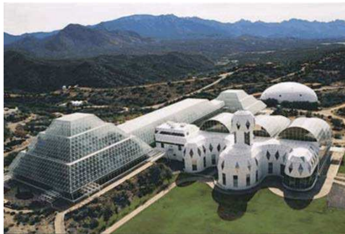
Figure 1 Biosphère 2 en Arizona

Entre 1987 et 1991, le projet « Biosphère 2 », un écosystème artificiel fermé a été construit à Oracle, Arizona (É.-U.). Il permettait l'étude et la manipulation d'une biosphère sans danger pour la Terre et l'exploration de l'utilisation de biosphères fermées dans une colonie spatiale.