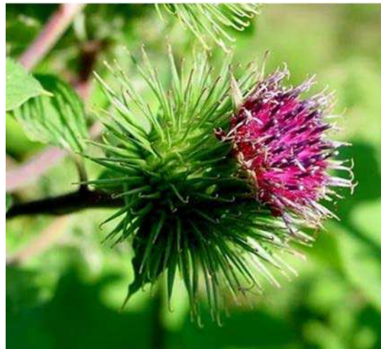
Figure 4 Arctium Lappa, appelée communément grande bardane ou chardon

Examinez la figure 4. Reconnaissez-vous la plante?