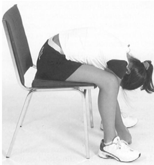
Figure A-1 Poupée en chiffon

Nota. Tiré de Fitness for Life: Updated Fifth Edition (p. 300), par C. Corbin et R. Lindsey, 2007, Windsor, Ontario, Human Kinetics. Droit d'auteur 2007 par The Cooper Institute.