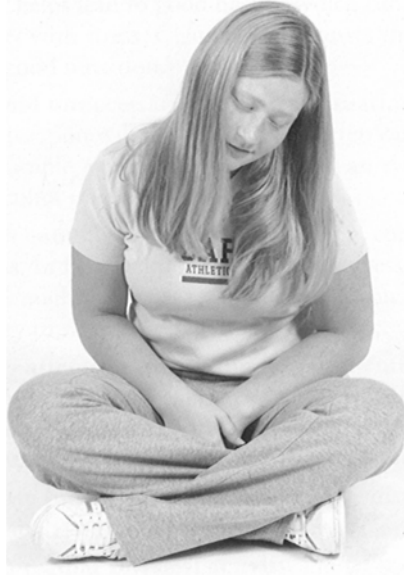
Figure A-2 Rotation du cou

Ne pas tourner la tête vers l'arrière ou en faisant un cercle complet.