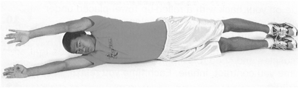
Figure A-3 Position de début de l'étirement du corps

Nota. Tiré de Fitness for Life: Updated Fifth Edition (p. 301), par C. Corbin et R. Lindsey, 2007, Windsor, Ontario, Human Kinetics. Droit d'auteur 2007 par The Cooper Institute.