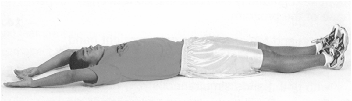
Figure A-4 Position finale de l'étirement du corps

Nota. Tiré de Fitness for Life: Updated Fifth Edition (p. 301), par C. Corbin et R. Lindsey, 2007, Windsor, Ontario, Human Kinetics. Droit d'auteur 2007 par The Cooper Institute.