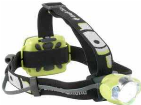
Figure 5 Lampe frontale

Lampe frontale. Une lampe frontale est constituée simplement d'une lampe de poche qui a été attachée à une courroie ajustable que l'utilisateur peut placer sur sa tête. Elle est pratique lors d'une randonnée car elle libère les mains de l'utilisateur pour compléter les tâches lorsque la lumière est faible ou qu'il fait noir.