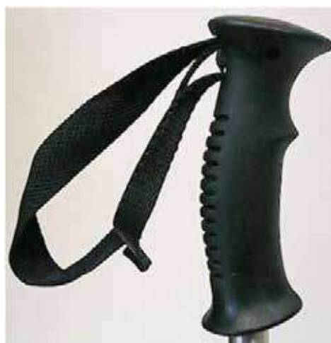
Figure 10 Poignée avec courroie

Poignées. Les poignées sont formées pour s'ajuster à la main sont plus confortables à tenir et plus faciles à utiliser sur une longue période de temps. Les poignées dures peuvent devenir humides avec la transpiration et être inconfortables à tenir. Il faut essayer plusieurs modèles pour trouver celui qui convient le mieux à la main. Une sangle réglable doit être fixée à la poignée pour éviter d'échapper le bâton.