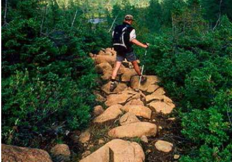
Figure 18 Sauter d'une roche à l'autre avec des bâtons de randonnée

Nota. Tiré de Great Outdoor, 2006, Hiking the Forgotten End of the AT , Copyright 2006 par Greatoutdoor.com. Extrait le 12 avril 2007 du site http://www.greatoutdoors.com/go/photos.jsp?title=hikingtheforgottenendoftheat&imag=1