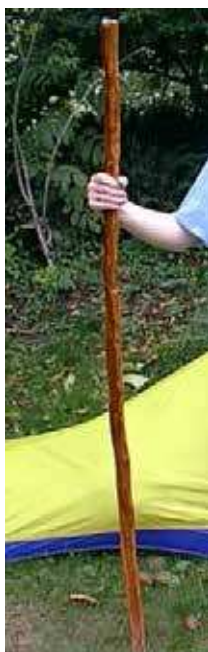
Figure 8 Bâton de marche en bois