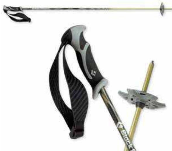
Figure 6 Bâton de ski

Les bâtons de ski et les bâtons de marche peuvent être utilisés pour les longues marches et les randonnées en montagne faciles, sur les surfaces assez planes. Le bâton de marche peut être un choix acceptable pour les randonnées en montagne de niveau moyen. Les bâtons de randonnée télescopique sont les plus versatiles. Ils fonctionnent bien pour la randonnée pédestre et pour la randonnée en montagne sur le terrain abrupte.