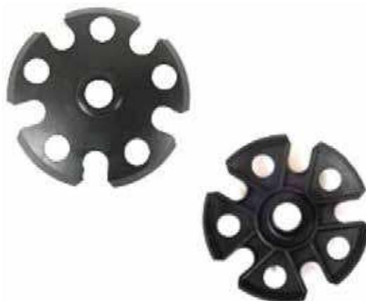
Figure 11 Disques en forme de flocon de neige

Nota. Tiré de Backcountry Edge, 2004, LEKI Snowflake Baskets , Droit d'auteur 2004 par Backcountry Edge, Inc. Extrait le 17 avril 2007 du site http://www.backcountryedge.com/products/leki/snowflake_baskets.aspx