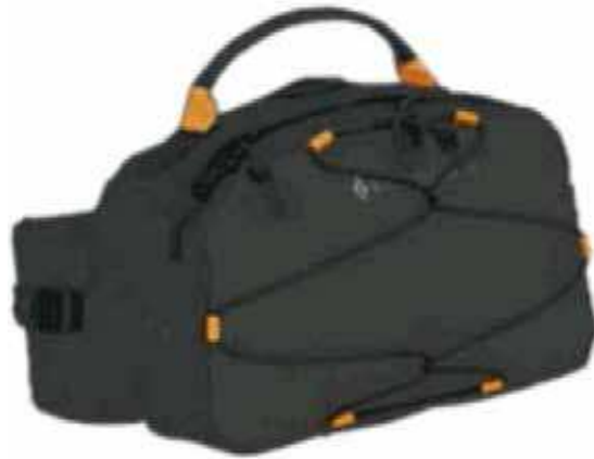
Figure 1 Sac banane