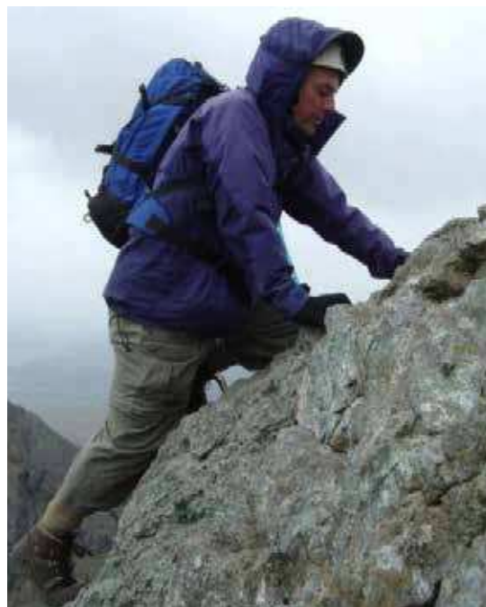
Figure 17 Technique de grimpée