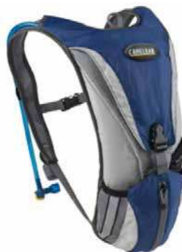
Figure 4 Sac-gourde