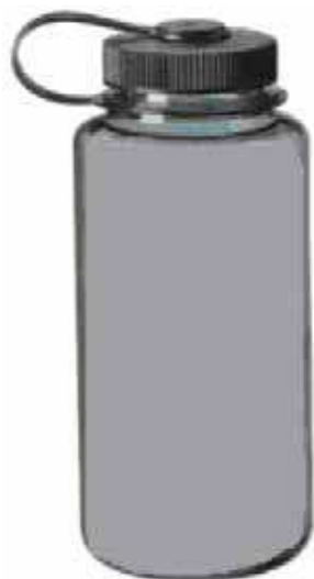
Figure 3 Bouteille d'eau à grand goulot

Les sacs-gourdes constituent un excellent équipement de transport de l'eau qui permet à l'utilisateur de transporter facilement entre 1 l et 4 l d'eau. Ils sont intégrés dans un sac et consistent en un réservoir souple de plastique léger et un tube d'hydratation qui passe par-dessus l'épaule de l'utilisateur et lui permet de boire facilement pendant une randonnée pédestre.