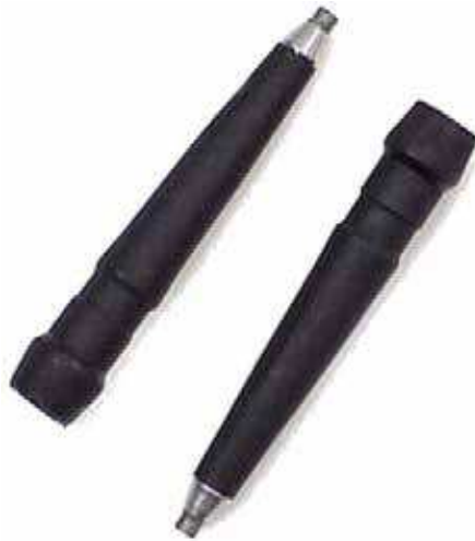
Figure 13 Bouts remplaçables