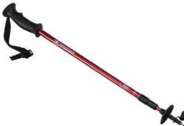
Figure 7 Bâton de randonnée télescopique