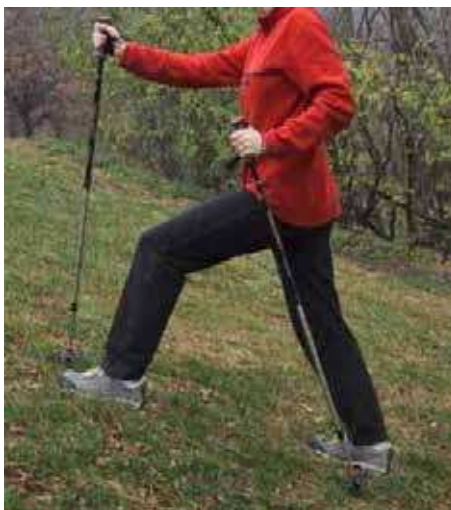
Figure 14 Monter une pente en randonnée en montagne