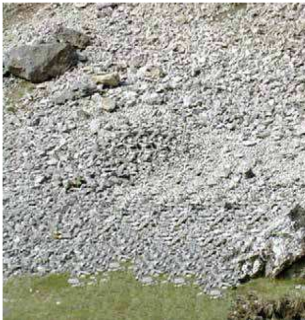
Figure 19 Éboulis