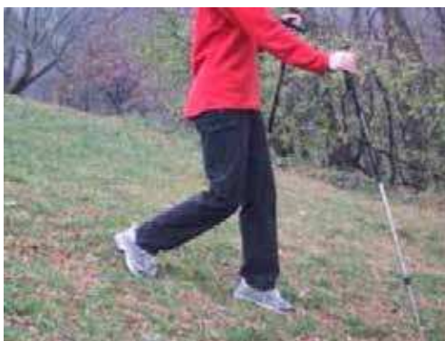
Figure 15 Descendre une pente en randonnée en montagne

Descendre une pente en randonnée en montagne. Les bâtons de randonnée aident à réduire le choc de chaque pas aux articulations lors de la descente. Pour plus de confort et de stabilité, il est recommandé d'allonger les bâtons.