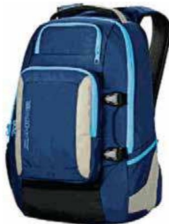
Figure 2 Sac à dos d'une journée