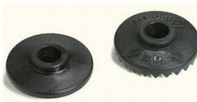
Figure 12 Disques pleins

Nota. Tiré de Backcountry Edge, 2004, LEKI Snowflake Baskets , Droit d'auteur 2004 par Backcountry Edge, Inc. Extrait le 17 avril 2007 du site http://www.backcountryedge.com/products/leki/snowflake_baskets.aspx