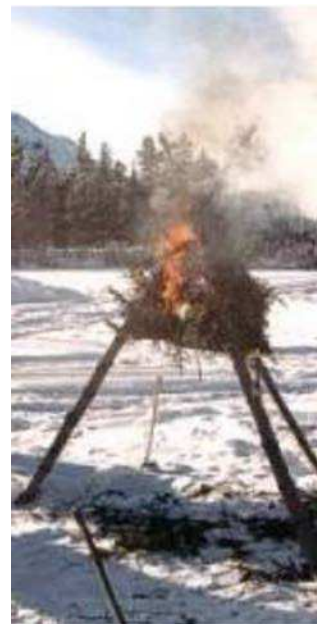
Figure 4 Feu en cône

Wiseman, J., The SAS Survival Handbook, HarperCollins Publishers (p. 506)