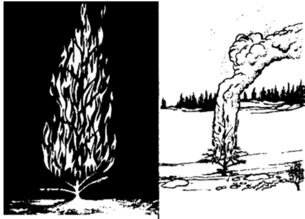
Figure 2 Un arbre en flambeau

« Signalling Techniques » par Wilderness Survival. Extrait le 12 mars 2007 du site http://www.wilderness-survival.net/chpt19.php