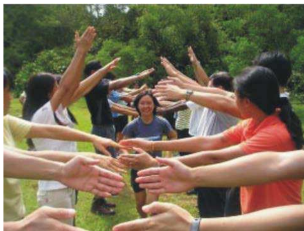
Figure 1 Jeu découper et trancher

Wilderness (2007). Index to Group Activities, Games, Exercises and Initiatives: Trust-Building Activities. (2007). Extrait le 26 avril 2007 à l'adresse http://wilderness.com/games/descriptions/SliceNDice.html